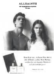
1.) 1 x L-Einleger