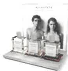
2.) 1 x Display