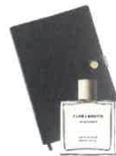
3.) GWP – Notizbücher Individuelle Verteilung

Es ist zwingend notwendig , dass Sie die Zweitplatzierung den gesamten Aktionszeitraum aufgebaut lassen, da feste Vereinbarungen mit unseren Industriepartnern getroffen sind.